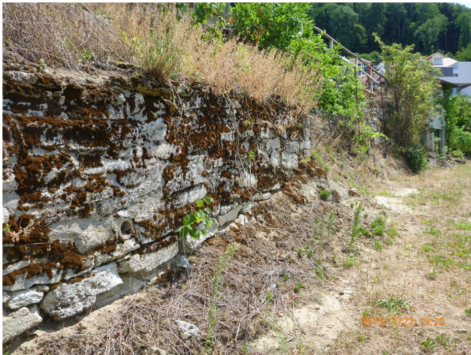
Photos de l'objet 22.07.2015